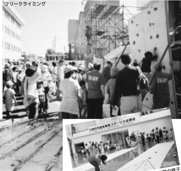
フリークライミング

ニュースポーツや体力測定、グラウンドや体育館などを利用し、いろいろなスポーツが楽しめます。ソフトバレーボール、インディアアカなど、指導者がいますので気軽に参加できます。初めての方も安心です。また、パン食い競争もあります。☞スポーツ振興課 ☎内線3324