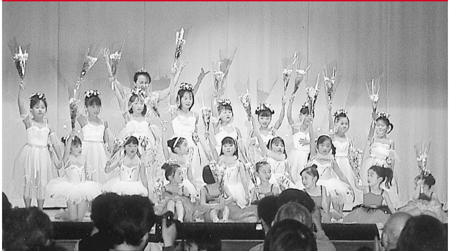
第33回のつどいに出演した子どもたちのダンス