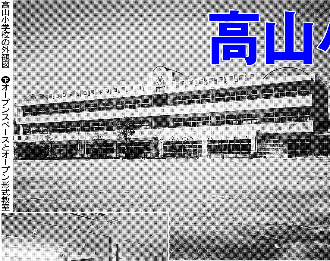
高山小学校の外観図 オープンスペースとオープン形式教室