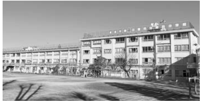
▲現在の第四小学校校舎

また、令和12年度中の新校舎の使用開始を目指す中原小学校の建替事業については、現在、基本設計を進めており、令和8年度中に実施設計に着手します。