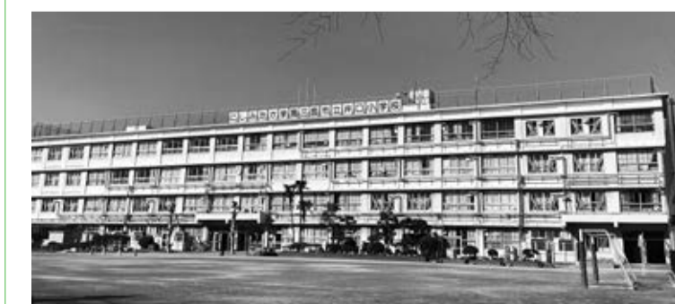
現在の井口小学校

工事期間中は児童・生徒、保護者及び近隣の皆様にはご不便をおかけしますが、安全確保を第一に進めますので、ご理解とご協力をお願いします。