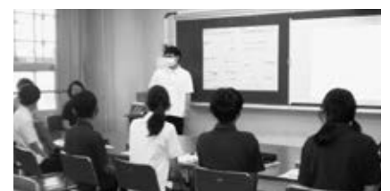
第二中学校での意見交換

子どもたちからの意見を聴くため、7月から8月にかけて各学園の中学校の生徒代表と教育委員会事務局職員との意見交換を行いました。生徒の皆さんは、「学校でどんなふうに学びたいか」や「学校がどんな場所だったらうれしいか」といった普段はなかなか考えないようなテーマにも、積極的に意見を出してくれました。