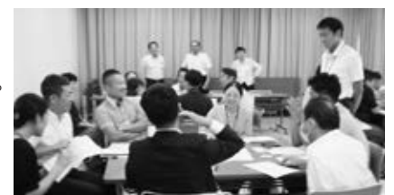
教育政策対話でのグループワーク

8月3日に開催された「教育政策対話」では、令和4年度に実施した「教員による政策提言ワークショップ」での提言に対する教育委員会の取組状況を報告するとともに、グループに分かれて教員と教育委員会事務局職員との意見交換を行いました。参加した教員は、教育委員会の施策について理解を深めながら、それぞれが持つ現場での思いや考えを共有しました。