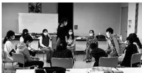
令和4年度キックオフミーティングの様子

みたかとしょかん図書部! キックオフミーティング! 日時 5月14日(日) 午後2時から4時まで 場所 三鷹図書館(本館) 2階第一集会室 ※事前申込は不要です。会場に直接お越しください。