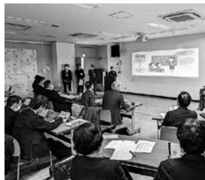
議論を重ねた政策について発表する先生たち