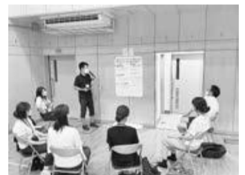
学園・学校におけるワークショップ

これらの意見を踏まえた上で、令和5年度以降、第5次三鷹市基本計画の策定に向けた検討と整合を図りながら、次期三鷹市教育ビジョン（仮称）の策定に向けて、子どもたちや幅広い市民、関係者の皆様と更に議論を深めていく予定です。