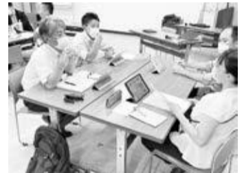
教員による政策提言ワークショップ

令和4年度は、各学校を代表して集まった先生が三鷹のこれからの教育に必要な政策を提言する「教員による政策提言ワークショップ」を行っています。また、夏休み期間中には、「学園・学校におけるワークショップ」として、各学園の先生がグループに分かれて議論を行いました。