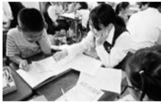
小・中交流の様子