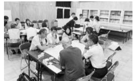
コミュニティ・スクール委員会での熟議の様子