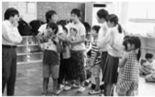
学園での班活動の様子