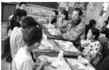
第七小学校の給食の様子

三鷹市の学校給食では、市内の農家の協力を得て、子どもたちに新鮮でおいしい野菜を提供するとともに、食育、地産地消、都市農業振興の観点から、市内産野菜の活用を推進しています。昨年12月6日、市立全小・中学校の給食では、東京むさし農業協同組合と協力農家のみなさんが届けた、旬のにんじん、白菜、大根、ブロッコリーを使った、「三鷹産野菜の日」を実施しました。メニューは、小学校では「豚汁とブロッコリーのおかか炒め」、中学校では「三鷹産野菜のそぼろ煮とブロッコリーのごましょうゆ」で、各学校の栄養士が工夫を凝らしたものでした。