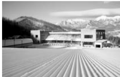
ハヶ岳を臨むゲレンデ

1日リフト券1枚付き9,700円から (1枚2,300円で2枚まで追加購入可) ※先着制。販売数に限りがありますので、お早目にお申し込みください。予約時にスキープラン利用とお伝えください。