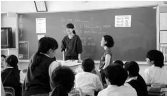
英語の相互乗り入れ授業(第一中学校)

南浦小学校と第一中学校では、外国語活動と英語において「相互乗り入れ授業」(小・中学校の教員が互いに行き来する授業)を行っています。小学校での英語の教科化を見据えて、中学校の先生が小学校6年生の外国語活動に、小学校の先生が中学校1年生の英語に、乗り入れを実施しています。