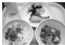
三鷹産野菜を使った豚汁とブロッコリーのおかか炒め