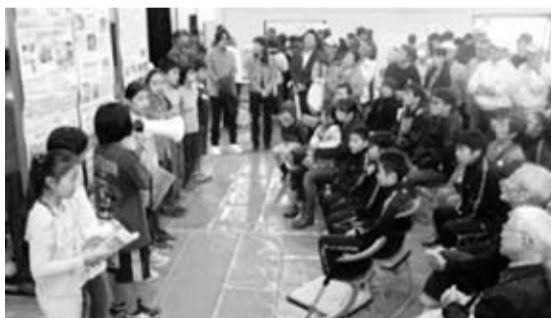
小学生の発表を聞く中学生と地域のみなさん(第四中学校)

三鷹中央学園では、小・中学校9年間を通して体系的な防災教育に取り組んでいますが、そこに欠かさないのが「地域との連携」です。例えば、三小と七小の5年生の防災の授業では、災害への備えや地震発生時の対応についてグループで考える「熟議」に地域の大人が加わり、まとめとして防災課の講話を聞きます。こうした学習を通して、児童から「学んだことを家族とも話し合いたい」という感想や地域の担い手としての意識も出てきました。また、児童の積極的な姿勢は、授業に参加した地域の方の防災意識も高め、地域とのつながりを一層深めています。