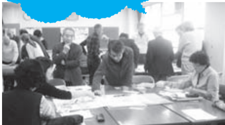
総合コース自主学習日の様子

三鷹市では、「ともに学び、学びを活かし、学びの成果や絆が地域に受け継がれていく心豊かな社会を作る」ことを基本目標に、市民一人ひとりの学習を支援しています。市民大学では、市民自らが主体となって企画してきた「総合コース」をはじめ、高齢者対象の「むらさき学苑」や子育てなどをテーマとする「一般教養コース」などを開講します。身近な地域の問題から今日の社会や世界を取り巻く問題まで、地域のみなさんと一緒に社会教育会館でともに学んでみませんか。