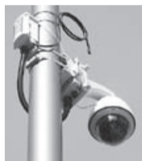
通学路に設置された防犯カメラ

高山小学校の通学区域内では、新たな集合住宅等の建設が相次いでいることから、今後数年の間に年少人口の大幅な増加が見込まれています。児童数と学級数の増加により、新たに普通教室の確保が必要と見込まれる高山小学校について、平成29年度当初からの使用開始に向けて、27年度の実施設計に基づき、学校敷地内に時限付き新校舎を整備し、適正な学習環境の確保を図ります。 時限付き新校舎は、現在の校庭東側に軽量鉄骨造2階建ての校舎として整備し、これまで普通教室に転用してきた特別教室等への活用を含め、普通教室で12教室分を確保することとしています。また、校舎の使用期間を14年間と見込んでいます。さらに、建物には、既存校舎とも遜色のない、耐久性の高い軽量鉄骨造とし、外壁や内装、教室の仕様についても、鉄筋コンクリート造りの校舎と同等の性能確保を図ります。 ⇒総務課☎内線 3224