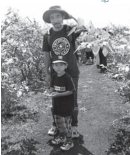
ブルーベリー狩りの様子

今後も川上村周辺の豊かな自然をいかしたツアーを実施しますので、ぜひご参加ください。