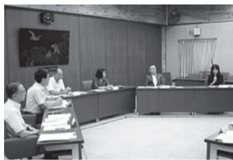
第1回総合教育会議の様子

7月17日(金)に第1回総合教育会議を開催しました。総合教育会議は、市長と教育委員会が協議・調整を図り、学校、家庭、地域と共に参加と協働による教育行政を推進するために設置した会議です。今回の会議では、三鷹市の教育に関する現状と課題や大綱等について意見交換を行いました。次回以降の会議日程は、決まり次第「広報みたか」および市ホームページでお知らせします。