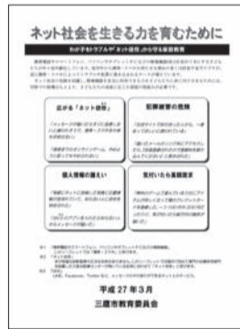
啓発リーフレット