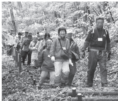
トレッキングツアーの様子

ご意見・問い合わせ 三鷹市川上郷自然の村 〒384-1406 長野県南佐久郡川上村大字原591-362 ☎0267-97-3206 FAX 0267-97-3207 HP http://www.sizennomura.jp/