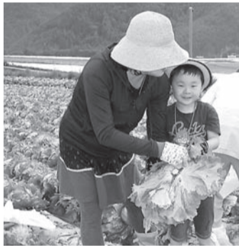
レタス収穫の様子

7月12日(土)～13日(日)に、日本一の生産量を誇る川上村の新鮮なレタスの収穫とブルーベリー狩りの両方を体験できるツアーを実施しました。参加された方からは、「畑が広くてびっくりした。」「川上村のレタスは新鮮でした。」「また参加したい。」などの感想をいただきました。