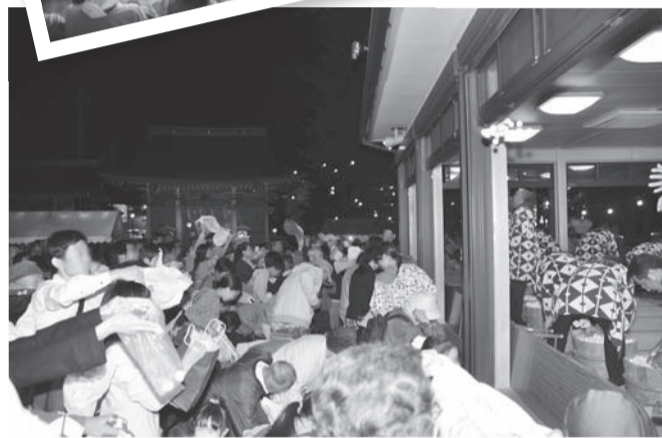
昨年度の団子まきの様子