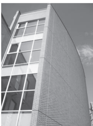
南部図書館が開館する公益財団法人アジア・アフリカ文化財団新施設の外觀(左)と完成間近の南部図書館の内部(右)