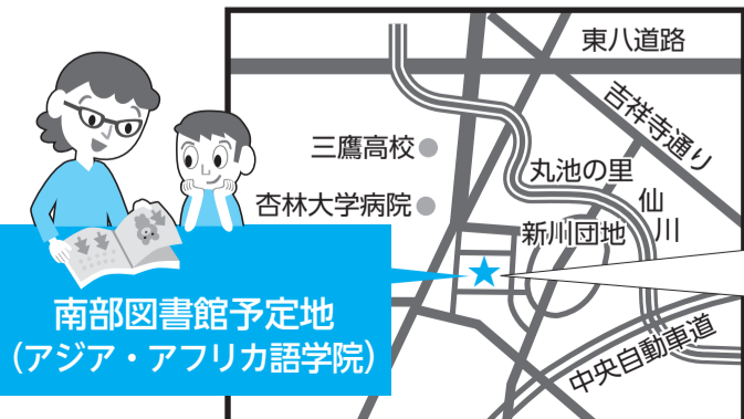
南部図書館予定地 (アジア・アフリカ語学院)