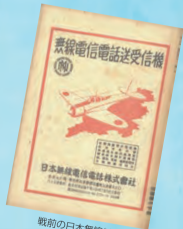
戦前の日本無線(株)のチラシ