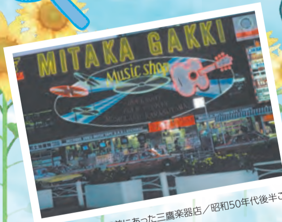
三鷹駅前にあった三鷹楽器店/昭和50年代後半ごろ