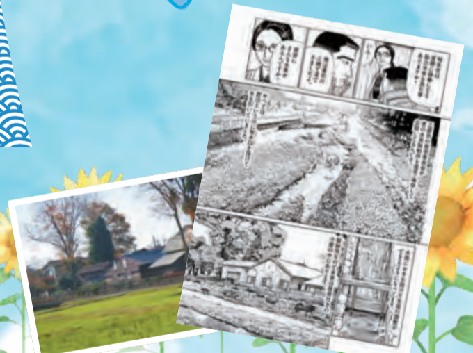
「そばもん ニッポン蕎麦行脚」©山本おさむ/小学館