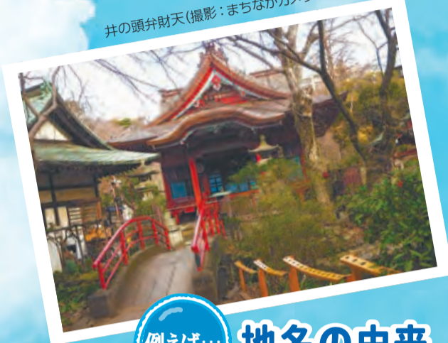
井の頭弁財天