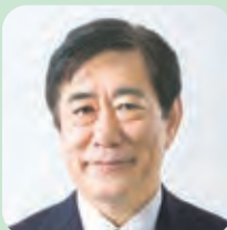
三鷹市長 河村 孝

私たちのまち「三鷹」は、どのようにして形作られてきたのでしょうか。その歩みを、私たちは地名からも知ることもできます。