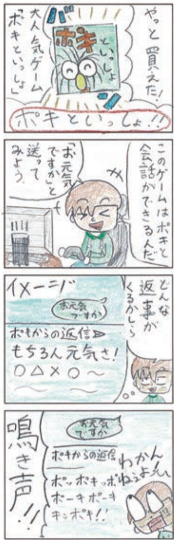
Poki4コマまんがコンテスト2025 ジュニア部門(入選)