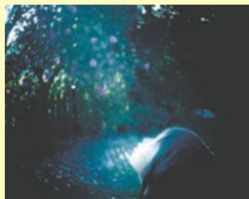
齋藤陽道『すべての別離はさりげない』 2022年撮影