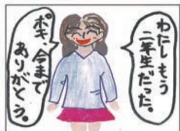
Poki4コマまんがコンテスト2025 ジュニア部門(入選)