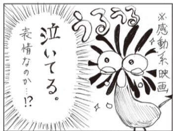
Poki4コマまんがコンテスト2025 ジュニア部門(入選)