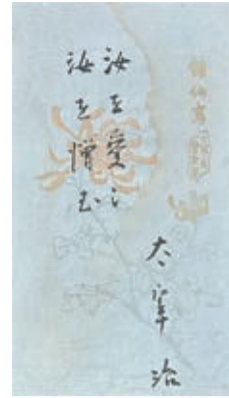
献呈先不明 「駆込み訴へ」(署名箋) 昭和17年1月 月曜荘 個人蔵