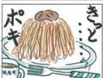
Poki4コマまんがコンテスト2025 一般部門(優秀賞)