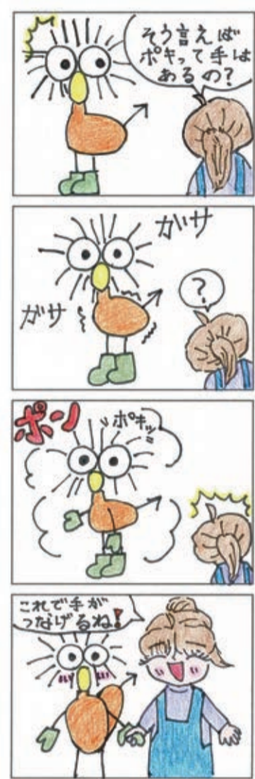
Poki4コマまんがコンテスト2025 ジュニア部門(優秀賞)

ポスト容器または電気式生ごみ処理機などを購入し、市内に設置した方(助成は1基まで)