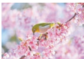
井の頭公園西園のメジロ (田中利明)