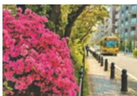
風の散歩道のツツジ (岡田和美)