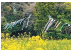
大沢の里のこいのぼり (佐久間俊輔)