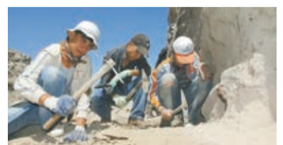
カマン・カレホック遺跡での発掘作業

人350人 所東京国立博物館平成館大講堂(台東区) 料¥2,000円(資料代を含む) 申3月3日(月)までに同研究所 ☐へ(先着制)