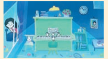
『Dancing in the rain』 葉 昭均