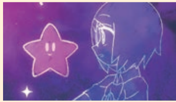
『MAGICAL GIRL』 岡 翔太