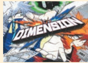
『DIMENSION』 チームディメンション