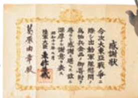
陸軍大臣・東條英機から送られた感謝状