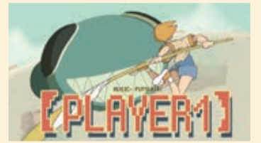
『[(PLAYER1)]』 アニメーションこうぼう。