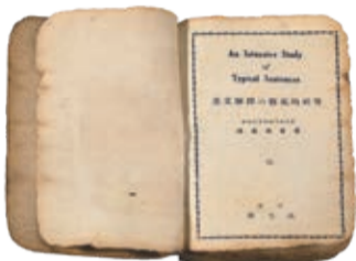
空襲で焦げた英語の参考書