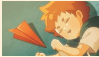
『僕のおりがみ大冒険』 僕のおりがみ大冒険製作委員会