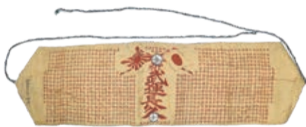
千人針(出征兵の弾よけのお守り)