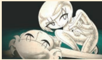
『ヨビとアマリ』 比留間 未桜