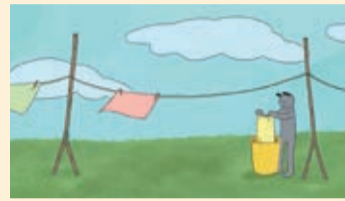
『WindyDay』 まるやま さくら