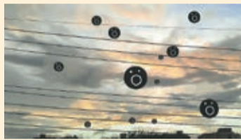
『身の周りの小さい人々〜あなたの知らないこの世のしくみ〜』 穴井 へてる