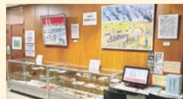
市役所3階の「みたか平和資料コーナー」