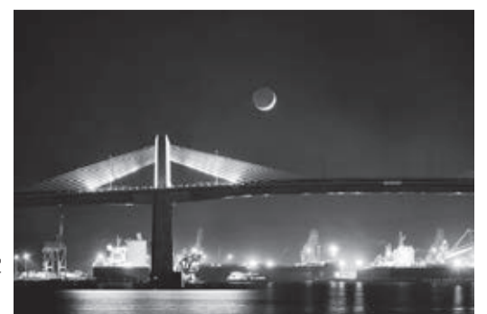
福島民友新聞社賞 「三日月ランブリッジに映える」