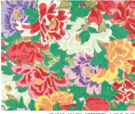
千代紙(牡丹) 河鍋暁斎 木版多色摺

三鷹市美術ギャラリー JR三鷹駅前(南口)CORAL5階 ☎0422-79-0033 https://mitaka-sportsandculture.or.jp/gallery/