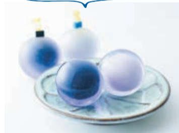
みたか都市観光協会の設立15周 年を記念して開発された「みたか 宙球(そらだま)ゼリィ」(11月15 日)