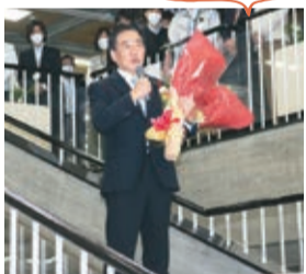
河村市長が再選、初登庁 (4月24日)