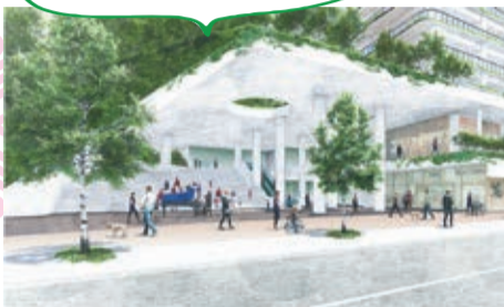
『三鷹駅前地区まちづくり基本構想』 『“子どもの森”基本プラン』を策定(2月) ※画像は同プラン事業イメージ。