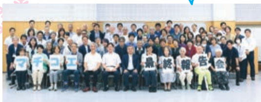
約2年間の活動の集大成として政策提案を市へ 提出(7月8日)