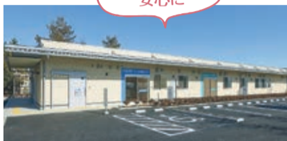
急病患者に備えた新施設「休日・夜間 診療所・薬局」がオープン(3月5日)