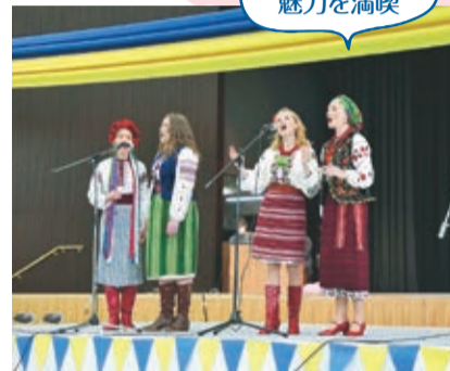
「ウクライナデー」を開催(3月5日)