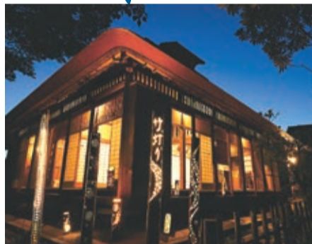
大沢の里古民家で企画展「大沢の里竹灯 り」を開催(7月29日～9月4日)