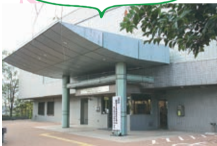
先進技術と高齢者の在宅生活をつなぐ新 たな拠点「福祉Laboどんぐり山」がオープ ン(12月1日)