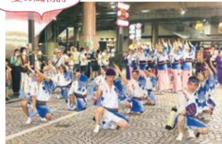
「三鷹阿波おどり」が4年ぶりに通常開催 (8月19・20日)