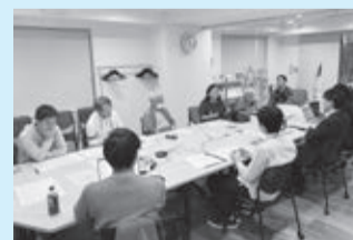
平和・国際交流グループと市職員との意見交換会の様子