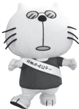
同プロジェクトマスコットキャラクター「たまらんにゃ〜」

今年が多摩地域が神奈川県から東京府(当時)へ移管されて130年目になる節目の年です。多摩30市町村などによる特産品やグルメを販売するほか、多摩の木材を使用した体験ワークショップを行います。