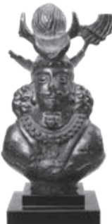
「帝王胸像 青銅」/ イラン(サーサーン朝)/ 5～7世紀

※市民以外の方も予約不要で入館できますが、入館料(一般1,000円、高校・大学生と65歳以上500円、中学生以下無料)がかかります。