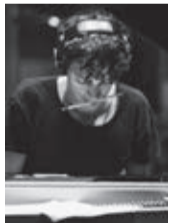
フランチェスコ・トリスターノ

曲第2番・第6番、トリスターノ：Serpentinaほか ピアノ1台でコンサートホールをダンスフロアのような空間にする“トリスターノ・マジック”。