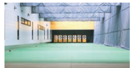
半屋外式の弓道場(写真左)とアーチェリー場(写真右)