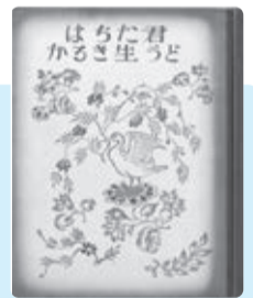
日本少国民文庫第5巻「君たちはどう生きるか」(新潮社(昭和12年8月))