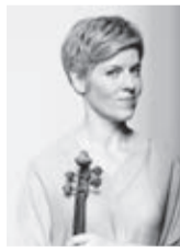
イザベル・ファウスト

バロック時代のバイオリン音楽の系譜をたどるとっておきの演奏会をお楽しみください。