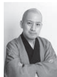
春風亭一之輔

三鷹市公会堂 光のホール 10月22日(日) 午後2時開演 チケット発売日(全席指定) 会員=8月12日(土) 一般=8月16日(水) 会員=3,150円 一般=3,500円 高校生以下=1,000円 ※購入は1人4枚まで。