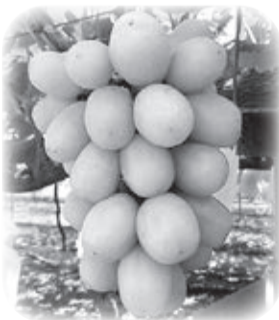
シャインマスカット