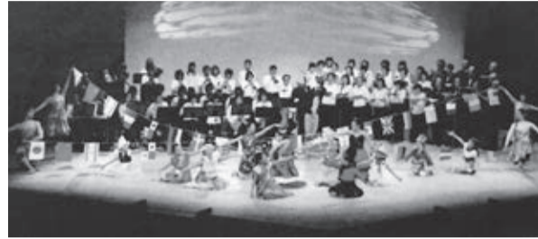
創立40周年記念舞台公演の様子