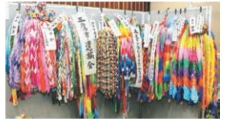
市民の皆さんからご提供いただいた千羽鶴も展示しています