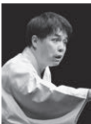
立川志らく

芸術文化センター 星のホール 9月18日(月・祝) 午後2時開演 チケット発売日(全席指定) 会員=8月13日(日) 一般=8月16日(水) 会員=2,700円 一般=3,000円 高校生以下=1,000円 ※購入は1人2枚まで。