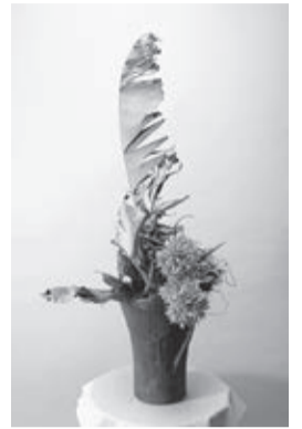
創立40周年記念展示作品