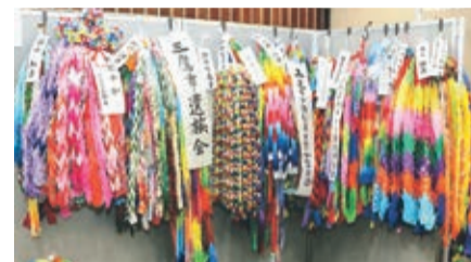
市民の皆さんからご提供いただいた千羽鶴も展示しています