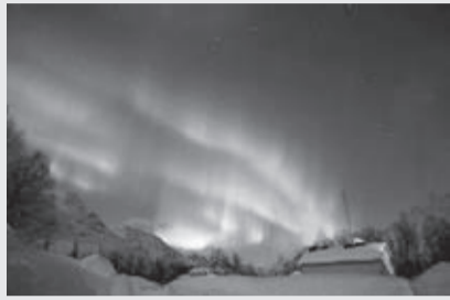
トロムソ(ノルウェー)のオーロラ

日 7月28日(金)～9月24日(日)午前11時～午後6時30分(月・火曜日、祝日休館) 申 期間中会場へ