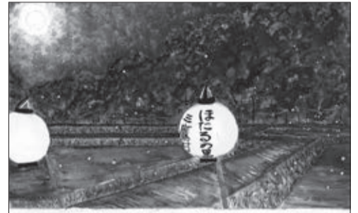
堂はみんなの優しさの姿

市長賞1点、環境基金活用委員会会長賞1点、教育長賞1点、優秀賞10点、環境メッセージ賞1点 ※受賞者には賞状と賞品を贈呈し、応募者全員に参加賞を差し上げます。