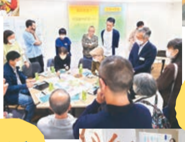
ヒアリング & 意見交換会