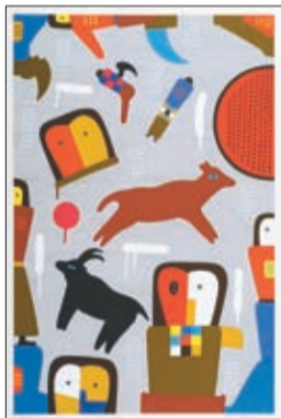
谷川晃一「森の記憶Ⅵ」1991年

三鷹市美術ギャラリー JR三鷹駅前(南口)CORAL5階 ☎0422-79-0033 🌐 https://mitaka-sportsandculture.or.jp/gallery/