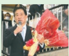
再選後の初登壇で、市民の皆さんや職員へ抱負を語る様子

今年3月に、担当者から『第5次三鷹市基本計画』の策定などに向けて実施した市民満足度調査の結果を受けました。その時は、「こんな結果が出ました」とためらいがちに切り出してきたのです。そんな風に報告されたら、誰もがよっぽど悪い数値かなと思いますよね。私もそう思い、どんな報告を聞いても動揺しないぞと覚悟を決めました。 ところが、結果は正反対。主要3項目(定住意向、市政の満足度、市役所への信頼度)では、「これからも住み続けたい、当分は住みたい」が93・1%、「三鷹市政に満足、まあ満足」が76・1%、「市役所を信頼できる、まあ信頼できる」が88・4%ということでした。調査はほぼ4年ごとに実施していますが、この数値は歴代最高レベルで、正直驚いてしまいました。 私が市長に就任してまもなく、新型コロナウイルスが猛威を振るい、皆さんも大変な思いをされたと思います。1期目の4年間、コロナ対策として300以上の事業を実施してきましたが、当初の計画は見直しや延期を余儀なくされ、やりたかったことがまだたくさん残っています。そうすると、この数値は今後に向けた「期待値」でしょうか。2期目となるこれからの4年間も、市民の皆さんと一丸となってまちづくりを進め、市民満足度のさらなる向上につながる新しい三鷹を創っていききたいと思えます。