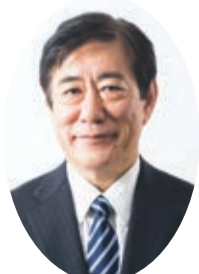
三鷹市長 河村 孝