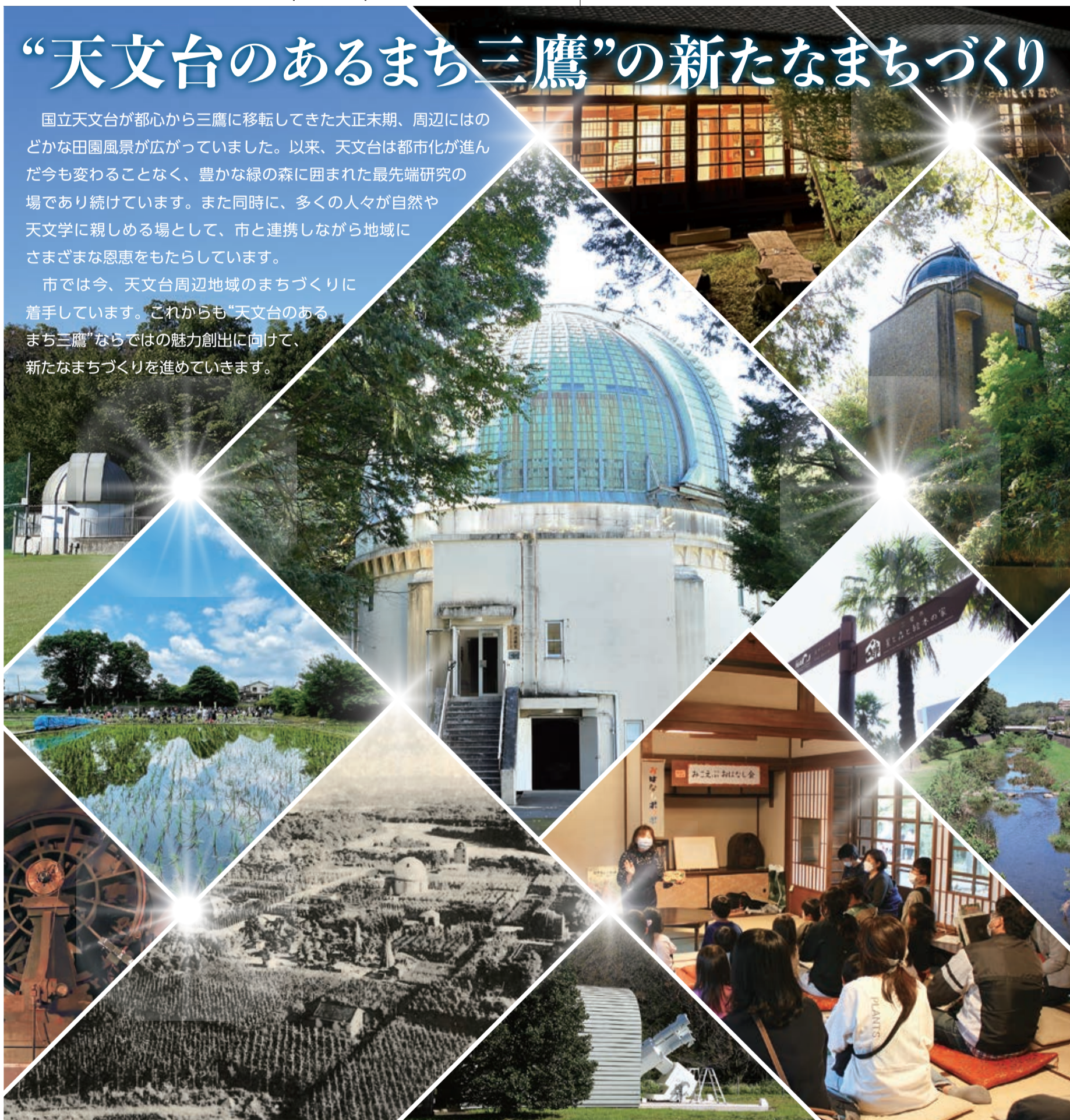
写真は、国立天文台の現在と三鷹への移転初期の様子、大沢地域の自然・施設を組み合わせました。

市では今、天文台周辺地域のまちづくりに着手しています。これからも“天文台のあるまち三鷹”ならではの魅力創出に向けて、新たなまちづくりを進めていきます。