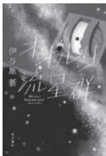
『オオール流星群』表紙イメージ