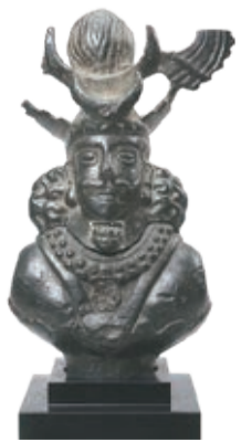
「帝王胸像 青銅」/イラン(サーサーン朝)/5～7世紀

申 9月30日(金)(必着)までに往復はがきで入館者全員の氏名(ふりがな)・年齢、人数、代表者の住所・電話番号、希望の入場日時、在学・在勤の方は所属、ミュージアムコンサート鑑賞希望者はその旨を「〒181-8555芸術文化課」へ(全員が市民で1組5人まで。申込多数の場合は抽選。結果は10月7日(金)以降に通知)