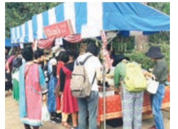
2019年開催時のようす