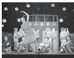
第9回公演「かたとき」 2022年3月/紀伊國屋ホール

何気ない日常を豪快に非日常へと変えていく、ここにしかないオリジナルシーンに満ちた舞台です。※本公演は、小学生以下は入場できません。