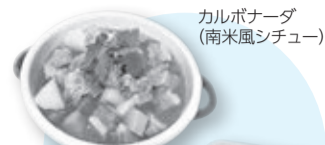
カルポナーダ (南米風シチュー)

☎8月14日(日)までに申し込みフォームHP https://logoform.jp/form/ejBZ/100575/ へ(申込多数の場合は抽選。当選者のみ8月19日(金)までにメールで通知)