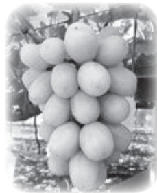
シャインマスカット