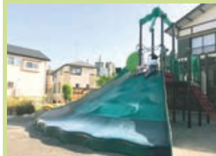
公園の遊具や名称は地域の皆さんにより決定