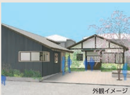
令和5年11月オープン予定

申 ふるさとチョイス(ガバメントクラウドファンディング) HP https://www.furusato-tax.jp/gcf/1602/