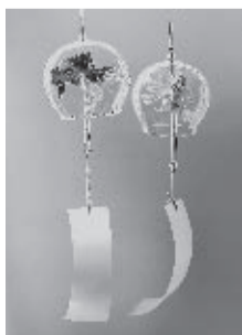
商品化部門最優秀賞 金魚風鈴 (長谷川貴子さん)