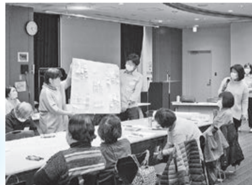
(※)3年度に設立した「市民参加でまちづくり協議会」では、市民参加の実践により、まちの声を聴き、「三鷹市基本構想」の改正や「第5次三鷹市基本計画」の策定に向けた政策提案につなげていきます。