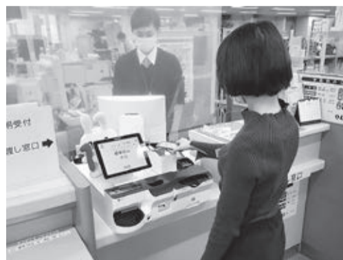
(※)新型コロナウイルス感染症対策と利用者の利便性向上を図るため、市政窓口での証明書交付などの手数料の支払いに、電子マネーやクレジットカードなどのキャッシュレス決済とセミセルフレジ(現金自動精算機)を導入します。

『令和4年度施政方針・予算概要』(1冊200円)、『令和4年度三鷹市一般会計・特別会計予算及び同説明書』(1冊900円)は、相談・情報課(市役所2階)☎内線2215で販売しています。また、市ホームページでもご覧いただけます。