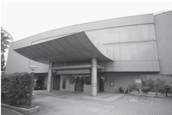
(※)5年度中の事業開始に向けて、サービス開発などの開設準備を行います。また、3年度からの実施設計を踏まえ、旧どんぐり山施設(写真)の改修工事に着手します。