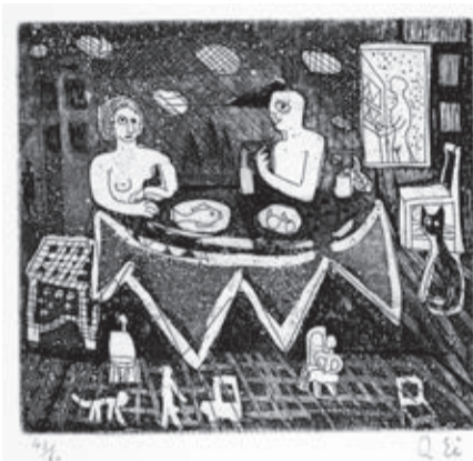
(左)「宇宙塵」1956年、(右)「版画集『瑛九・銅版画 SCALE IV』より132朝食 1951」 1983年 森秀貴・京子コレクション