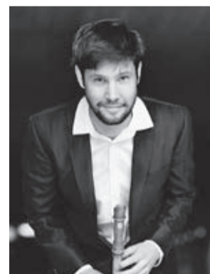
シュテファン・テミング

[曲目]モンテベルディ:かくも甘い苦悩を、あの高慢な眼差しを ほか ドイツのリコーダー・キングが三鷹に初登場!