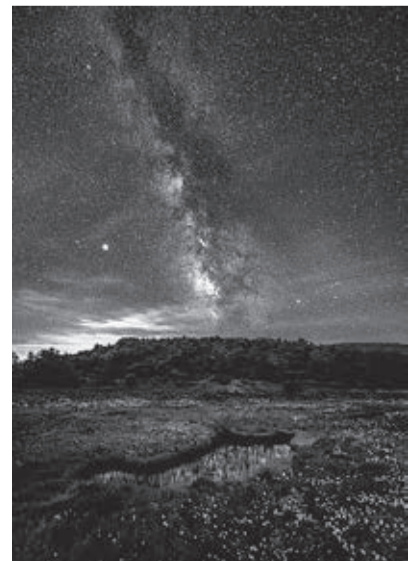
名譽館長特別賞「高原が輝くとき」