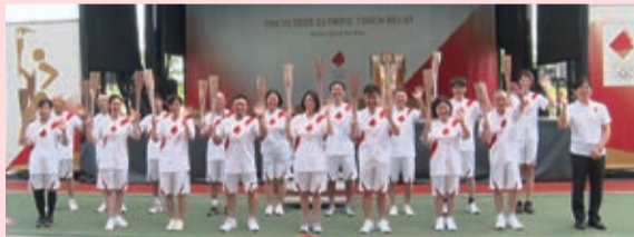
オリンピック聖火リレーの点火セレモニー

1年の延期を経て、7・8月に開催。三鷹市では、オンラインイベントなどを通して選手を応援。