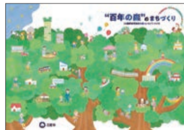
「百年の森」のまちづくり(三鷹駅前再開発事業コンセプトブック)を作成(3月)