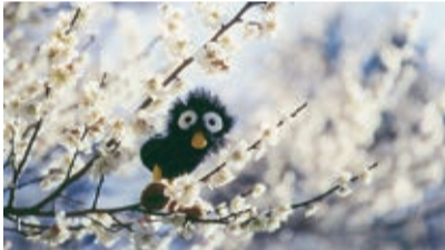
三鷹のキャラクター「Poki(ポキ)」のオリジナル壁紙を無料配信(10月1日)