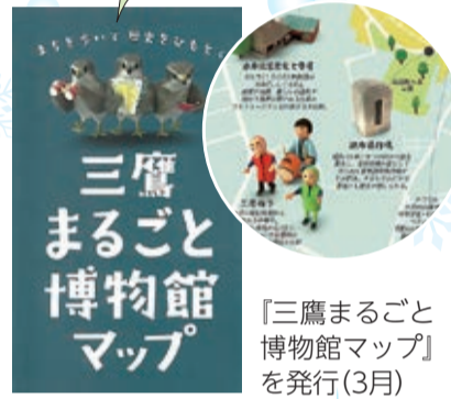
「三鷹まるごと 博物館マップ」 を発行(3月)