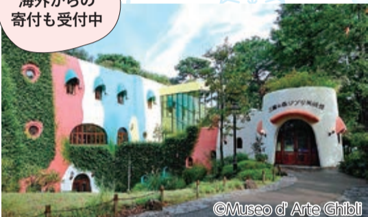
三鷹の森ジブリ美術館の運営資金をクラウドファンディングで募り、わずか1日で目標金額を達成(令和4年1月31日(月)まで受付継続中)