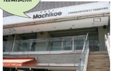
新施設「Machikoe(マチコエ)」がオープン(11月9日)

私には、この一年間を振り返るとき、コロナ禍で日本経済が停滞し、これまで見えてこなかった社会の亀裂が見えてきたと感じています。「子どもの貧困」や「超高齢社会」の課題は、当然以前から言われてきたことですが、このコロナ禍が、それをさらに顕在化させたと思っています。ダムが干上がり、ひび割れた底が見えてきたといったところでしょうか。 しかし、うれしい誤算もありました。新たな市民参加の実践として、「市民参加でまちづくり協議会」への参加を4・5月に呼び掛けたところ、何と400人もの方が応募してくれたのです。本当に驚き、また感動しました。これはほんの一例です。11月には、さまざまな市民参加の活動拠点として多くの人が利用いただける施設「Machikoe(マチコエ)」もオープンし、年末にかけて市民の皆さんが至る所で一斉に動き出しています。三鷹の「底力」は凄いなと改めて感じています。これまででもまちづくりの課題を打ち破ってきたのは市民の皆さんの声でした。来年も干上がったダムの底を水であふれさせるような、力強い皆さんのパワーに期待しています。