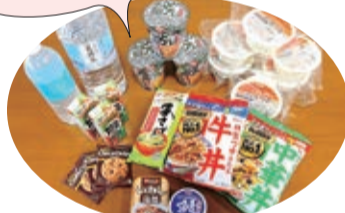
自宅療養者へ市独自の支援を スタート(9月2日)