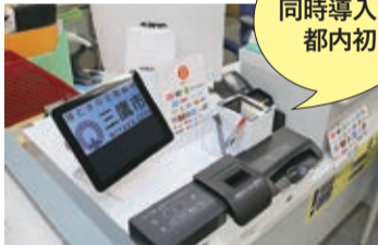
市民課窓口でキャッシュレス決済とセミセルフレジを導入(1月18日)