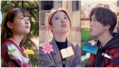
三鷹のまちを元気にするオリジナル動画を YouTubeで配信(2月4日)