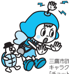
三鷹市詐欺被害防止キャラクター「チョット待ったさん」とたしかメくん